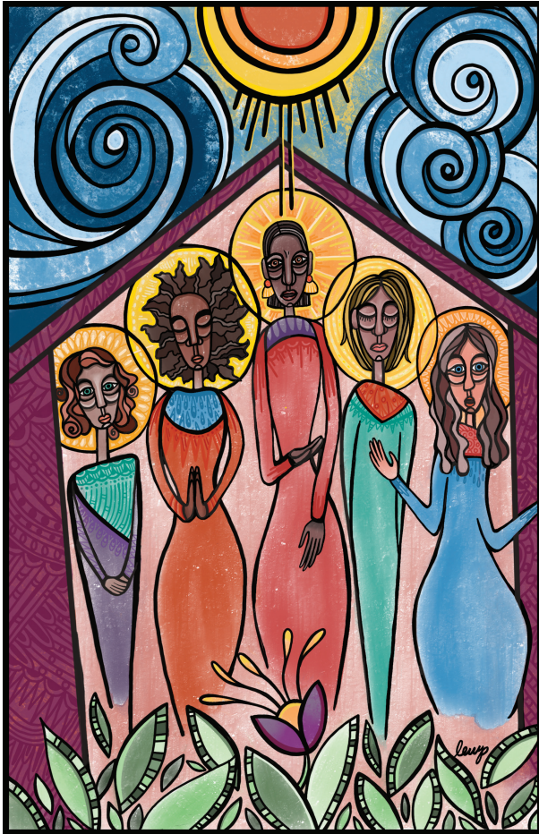
Se pararon (hijas de Zelofehad), Lauren Wright Pittman

Domingo para Celebrar los Dones de las Mujeres 3 de marzo de 2024